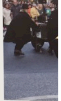
Malas Compañías Pro...

Zanguango Teatro continúa profundizando en el filón de fotocopiar todo aquello que acontece en la calle, tal cual ya habían iniciado con Flux , uno de los mejores espectáculos ▶